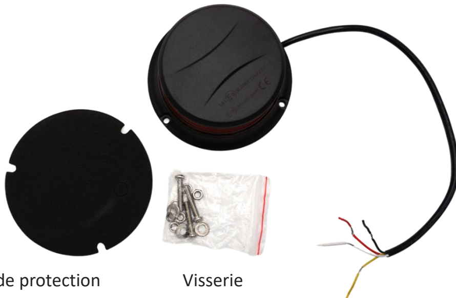
Mousse de protection