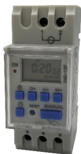
Horloge de programmation