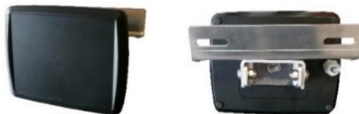
Capteur de détection de véhicule