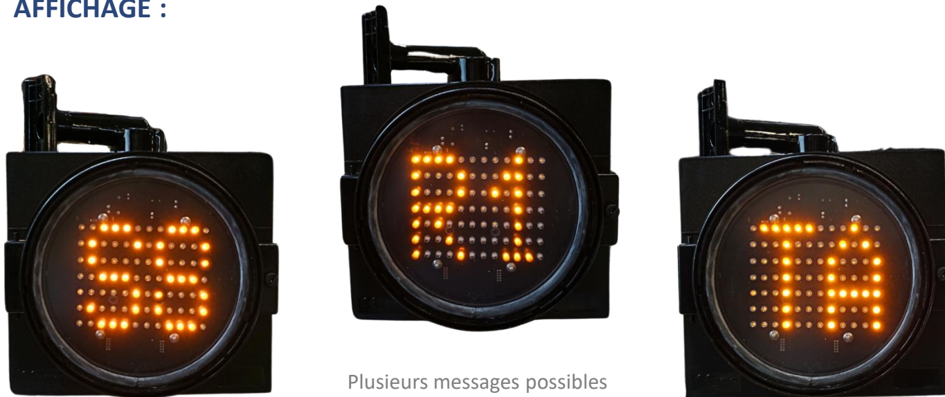
Plusieurs messages possibles