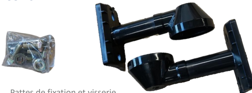
Pattes de fixation et visserie