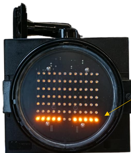
Affichage neutre dans le cas où le feu est allumé mais n'indique aucun message