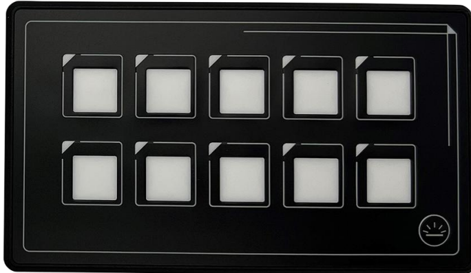
Version boutons vierges