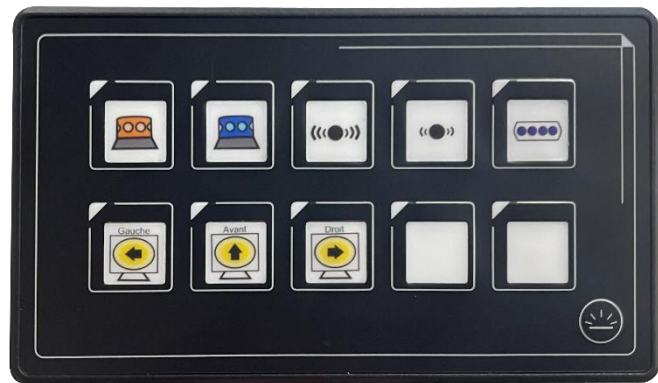
Exemple boutons personnalisés