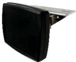
Capteur de détection Réf : 130452