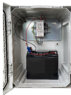
Coffret Éclairage Public