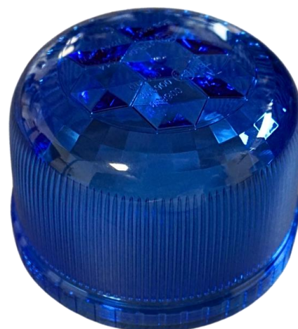
Cabochon en polycarbonate bleu démontable