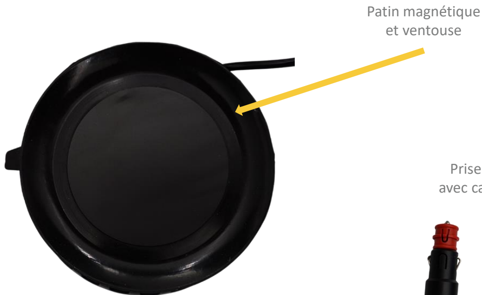
Prise allume-cigare avec cache de sécurité