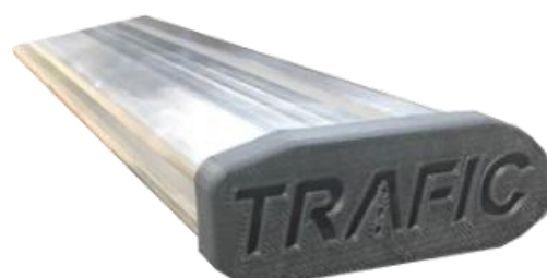
Caches latéraux de finition