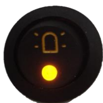
Interrupteur gyrophare en option