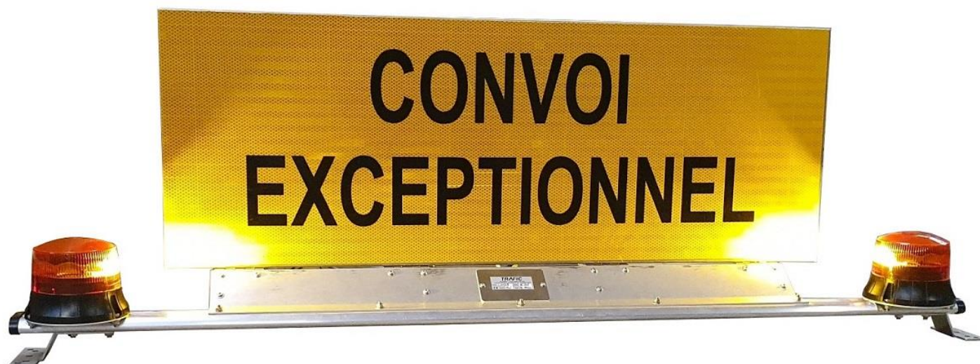
Version 1500 mm