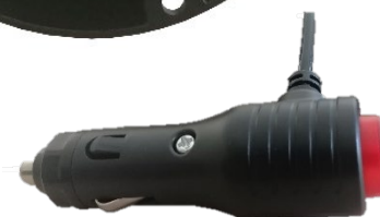
Prise allume-cigare avec bouton pour sélection du mode de clignotement