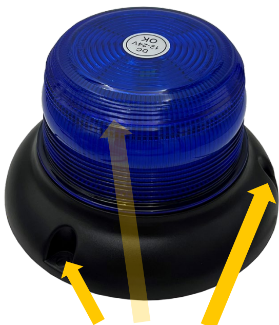
3 trous de fixation