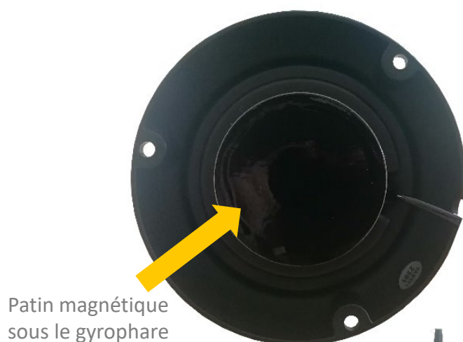
Patin magnétique sous le gyrophare