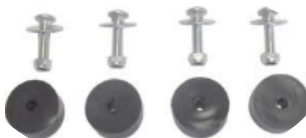
4 silentblocs + visserie fournie