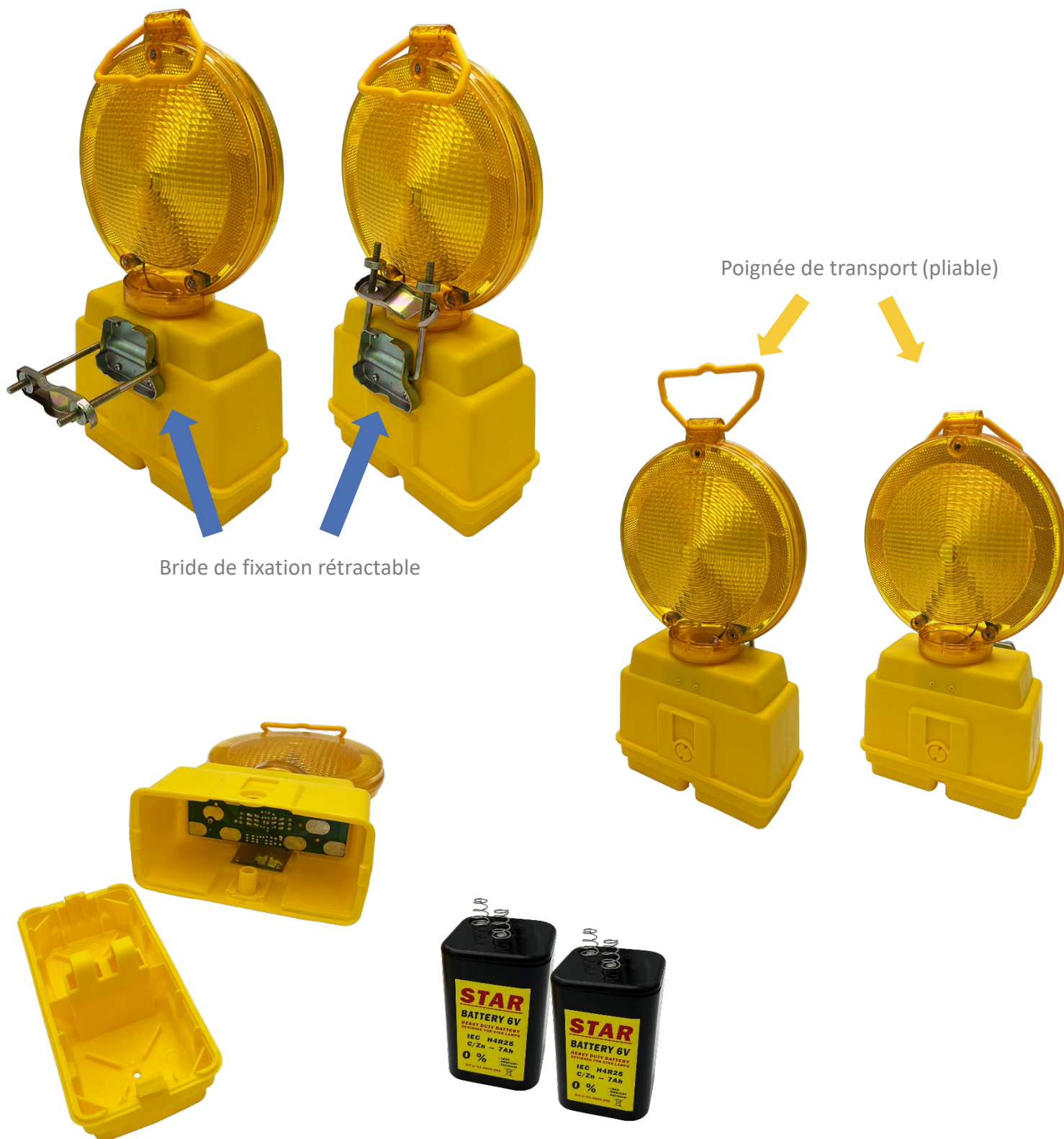
Bride de fixation rétractable